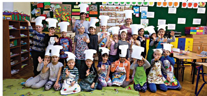
Mali kucharze wywiązali się ze swoich obowiązków bez zarzutów.