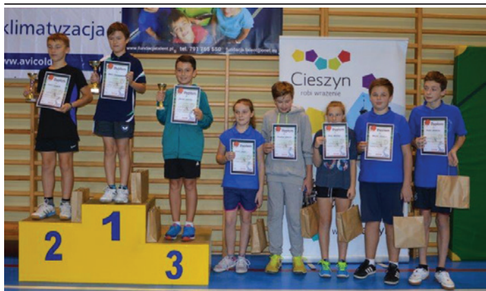
Najważniejszy moment – wręczenie nagród.