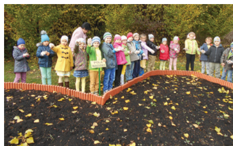
Serduszkowa rabata z żonkilami.

23 października podczas uroczystego apelu w towarzystwie zaproszonych gości rozpoczęliśmy drugą edycję kampanii Pola Nadziei. Pierwszoklasiści mieli okazję zasadzić w serduszkowej rabacie żonkile, by w ten sposób dołączyć do akcji. W ramach pomocy charytatywnej na rzecz hospicjum od września zdążyliśmy już zebrać 72 kg zakrętek. Ale czeka nas jeszcze wiele wyzwań.