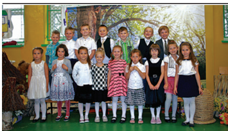
Dumne pierwszaki z SP7.

14 października 2015 tuwimowska lokomotywa przywiozła pierwszaków na uroczyste pasowanie. Emocji ze strony sześć- i siedmiolatków było sporo, nie mówiąc już o wzruszonych rodzinach, ponieważ dzieci, żeby otrzymać tradycyjny róg obfitości, musiały odwiedzić pszczelą rodzinę i wykonać kilka zadań. Należało odwiedzić uczniów klas drugich i klasy trzeciej, bo to oni byli „przewodnikami” dla pierwszoklasistów po Matematycznej Wyspie i po Zagadkowie. Po rozszyfrowaniu tajemniczej Mapy do SP-7 wszyscy uczniowie otrzymali certyfikat przynależności do społeczności uczniowskiej.