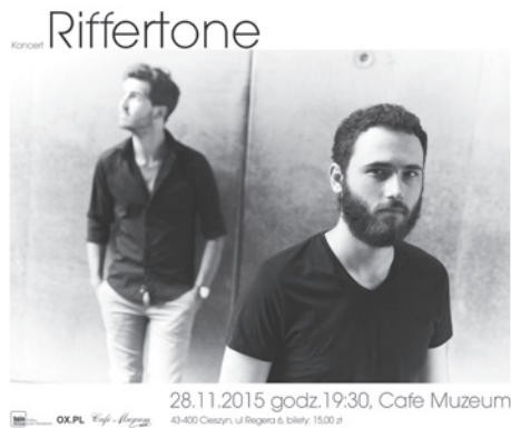
28.11.2015 godz. 19:30, Cafe Muzeum 43-400 Cieszyń, ul. Bielska 4, bilety: 15,00 zł