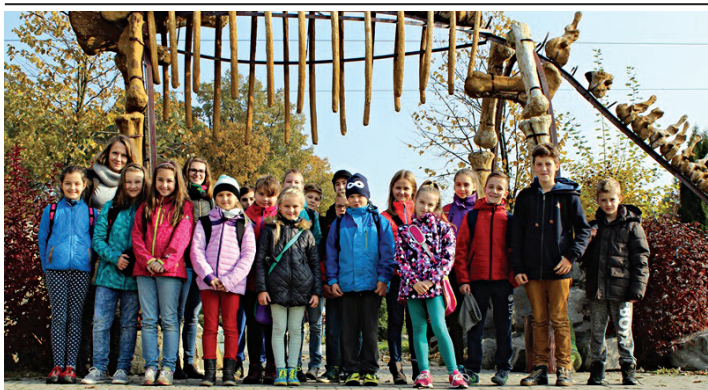
W Dream Parku wszystkim się podobało.

30 października uczniowie Szkoły Podstawowej nr 3 z Oddziałami Integracyjnymi w Cieszynie wybrali się na szaloną wycieczkę do Dream Parku w Ochabach. Dzięki udziałowi w projekcie Euronet 50/50 mogli zupełnie za darmo i bardzo przyjemnie spędzić całe wyjątkowo słoneczne popołudnie. A zaczęło się od parku miniatur, w którym uczniowie zobaczyli m.in. Wieżę Einsteina, World Trade Center, Świątynię Lotosu, Armię Terakotową, Mount Rushmore National Memorial, Krzywą Wieżę w Pizie i wiele innych ciekawych budowli.