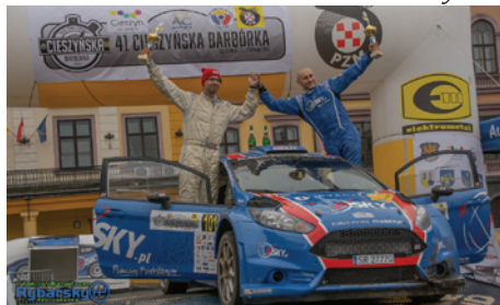
Na mecie rajdu w Cieszynie.