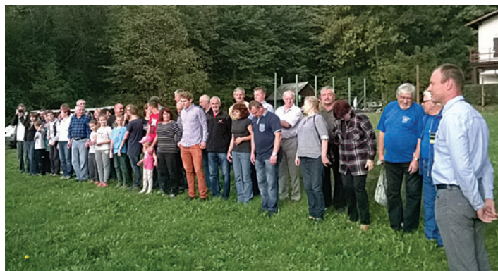
Klub Żeglarski Sternik zaliczył kolejny udany sezon.