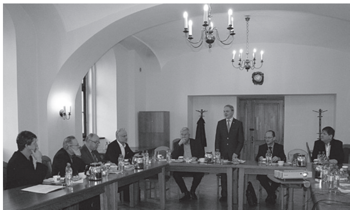
Spotkanie w sprawie połączeń kolejowych odbyło się w magistracie.