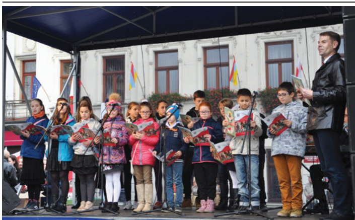
Pierwsze dwie piosenki na VIII Lekcji Śpiewania zaśpiewali uczniowie Szkoły Podstawowej nr 7 w Cieszynie.

W kilku miejscach w Cieszynie fetowane było odzyskanie przez Polskę niepodległości. Uroczystości w środę 11 listopada odbyły się między innymi w kościele Jezusowym, na Placu Wolności oraz Rynku.