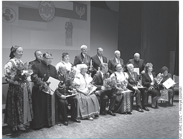
Wyróżnieni podczas uroczystej Sesji Rad Samorządów Ziemi Cieszyńskiej.